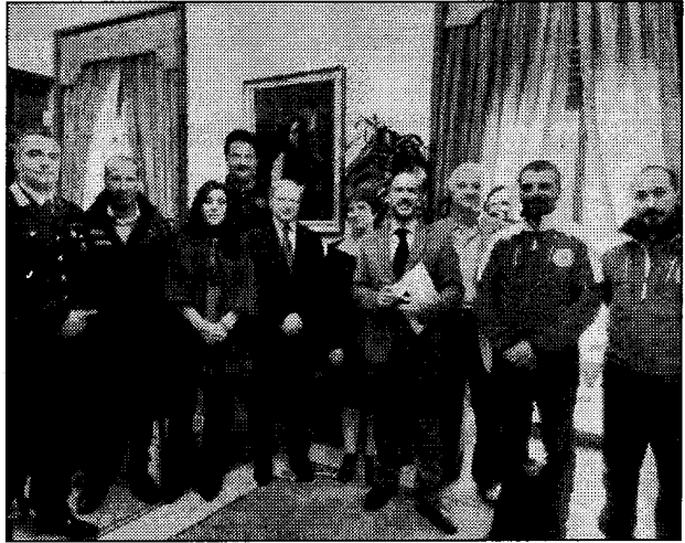
La foto scattata in Prefettura al termine del vertice

Le attività di soccorso in grotta, per la loro complessità, coinvolgono di norma l'intervento congiunto di diversi servizi regionali del Corpo Nazionale Soccorso Alpino e Speleologico (Cnsas), per cui è indispensabile organizzare esercitazioni interregionali di soccorso al fine di migliorare la preparazione tecnica ed il coordinamento delle squadre.